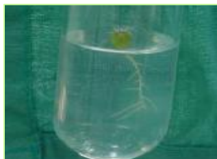
Semilla de M. actinacanthus germinada in vitro