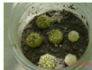
Método de cultivo tradicional utilizado para su propagación