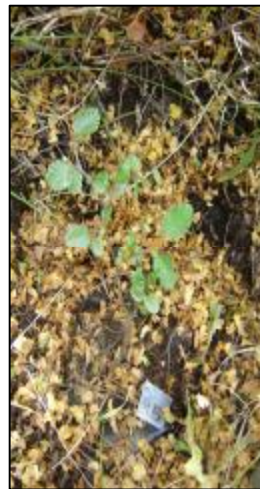
Postura de N. pumilio protegida de la herbivoría