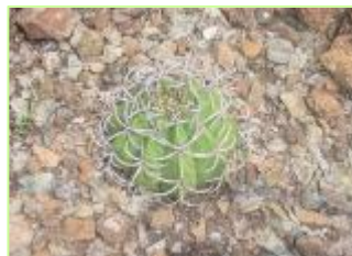
Ejemplar de M. actinacanthus plantado en áreas naturales

Las opiniones sobre este boletín son importantes para mejorar las próximas ediciones, envíen sus valoraciones y sugerencias sobre la calidad de los artículos, informaciones, iniciativas, diseño, etc. a este correo: sisrec2007@uclv.edu.cu Queremos que este boletín responda a los objetivos de RIACRE y a sus necesidades de información. Recuerde que para ello también necesitamos de usted.