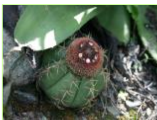
Melocactus actinacanthus en su hábitat natural

Esta secuencia de imágenes ilustra el comentario realizado en la página 7 sobre el proyecto de restauración de la población de M. actinacanthus