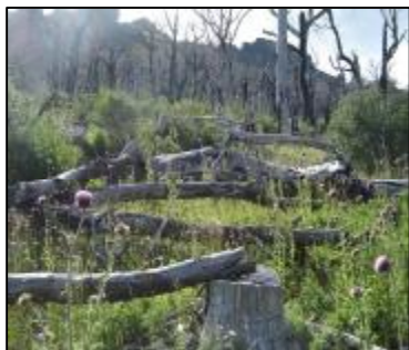
Bosque quemado de Nothofagus pumilio

A pesar de la importancia que todos los aspectos citados confieren al bosque de lenga, en la actualidad, éste se ve amenazado por tres factores antrópicos relevantes: fuego, sobrepastoreo y la explotación de madera no planificada, haciendo que la recuperación de los mismos sea sumamente lenta y variable.